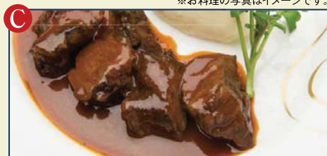
広島県産和牛ほほ肉の赤ワイン煮込み