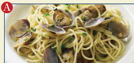
シェフのおすすめパスタ(週替わり)